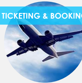
TICKETING & BOOKING